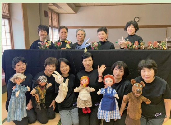
人形劇 なづみ座の皆さん

この賞は公益社団法人読書推進運動協会から読み聞かせボランティアなどすぐれた活動を行っている団体に贈られるものです。