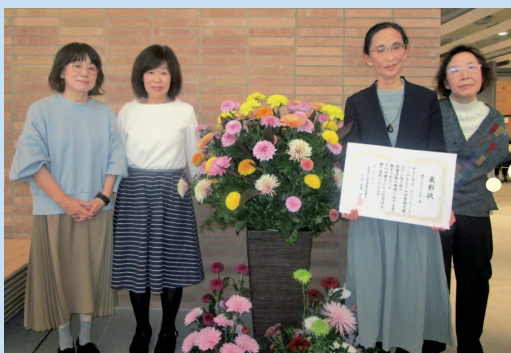
諫早おはなしの会の皆さん